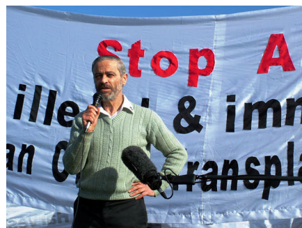
前·天主教堂神父彼得·卡如安纳在国会集会上发言