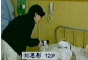
气管切开还能说、唱？记者采访不穿防护服，不戴口罩