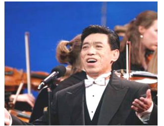
在全球华人新年晚会上演出 (纽约无线电音乐城，2006年)

关贵敏经常与朋友说“人的思想就如同水，放在什么容器里，就成什么形状。中共让你习惯于它灌输的党文化，到一定时候再改变非常之难，甚至让你心甘情愿地为它唱赞歌。”