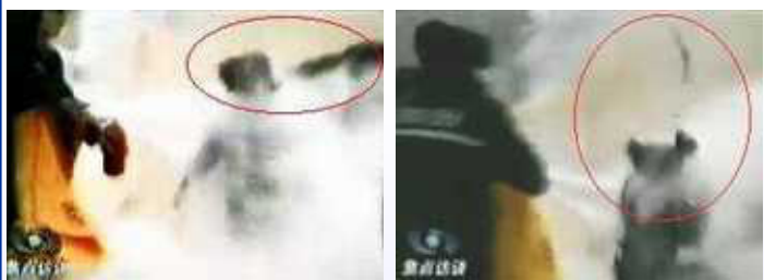
《是自焚还是骗局》真相电视片，是将中央台的“自焚”电视慢镜头播放，观众可清晰的看出：所谓的自焚女子刘春玲，是被打死而非烧死。 图 1：有人用物体猛击刘春玲的头部，刘随即倒地。 图 2：一条状物快速弹起，从死者脑后飞出数米远。

3.05 电视插播简况： 2002年3月5日，吉林省长春市有线电视网络的八个频道被插播《法轮大法洪传世界》、《是自焚还是骗局》等法轮功真相电视片，时间长达四、五十分钟。