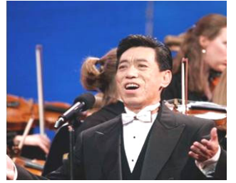
在全球华人新年晚会上演出 (纽约无线电音乐城，2006年)

关贵敏经常与朋友说“人的思想就如同水，放在什么容器里，就成什么形状。中共让你习惯于它灌输的党文化，到一定时候再改变非常之难，甚至让你心甘情愿地为它唱赞歌。”