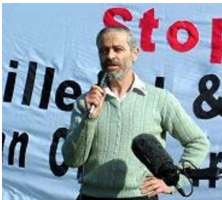
澳洲天主教会神父彼得·卡如安纳在新闻发布会上发言