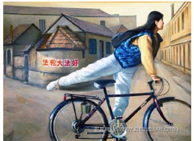
作者：董锡强，油画 48 英寸 x 36 英寸 (2004 年)

一天清晨，一位年青的姑娘将法轮功的真相材料送给小镇上的人们，并在民居的墙上写上“法轮大法好”。