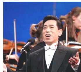
在全球华人新年晚会上演出 (纽约无线电音乐城，2006年)

关贵敏经常与朋友说“人的思想就如同水，放在什么容器里，就成什么形状。中共让你习惯于它灌输的党文化，到一定时候再改变非常之难，甚至让你心甘情愿地为它唱赞歌。”