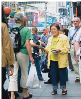
停一下你匆匆的脚步吧

目前，一些不明真相的世人面对法轮功学员讲真相的活动时，不顾法轮功学员的一心劝善，或不屑一顾拒绝真相，更有甚者恶语相向，他们即将失去的就是无比珍贵的机缘，而那机缘正是生命走向未来的金钥匙。