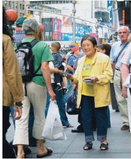
停一下你匆匆的脚步吧

目前，一些不明真相的世人面对法轮功学员讲真相的活动时，不顾法轮功学员的一心劝善，或不屑一顾拒绝真相，更有甚者恶语相向，他们即将失去的就是无比珍贵的机缘，而那机缘正是生命走向未来的金钥匙。