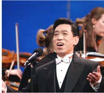
在全球华人新年晚会上演出 (纽约无线电音乐城, 2006年)