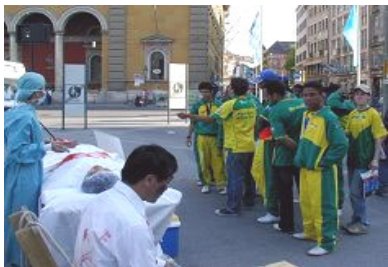
导游给巴西球迷翻译展板

了解了真相的各国民众纷纷签名支持反迫害、谴责中共暴行。签名者包括德国、南韩、台湾、