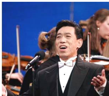
在全球华人新年晚会上演出 (纽约无线电音乐城, 2006年)

12个人，你给他们讲讲。”在处级干部的协助下，那12个人都退出邪党了。处级干部回去后，又向身边的同事、亲朋好友劝退，至今有32人退出邪党。