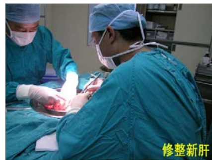
中山大学肝脏移植中心的医生在作手术 正在处理被摘取下来的肝脏

也就是说，假如某秘密集中营或劳教所，只要采集一次法轮功学员的血样，（一般几十毫升就够了），拿去做血型和组织鉴定分析后，把所得数据存在计算机里，再由某核心机构将数据收集汇总，就可得到一个全国性的器