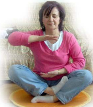
土耳其桃姆瑞思在炼功

需要每天两次注射药物，两年来天天注射，我的腿和胳膊上打针打得青一块紫一块，可就在这短短的9天，身上所有的青紫印都神奇地消失了。我和家人都吃惊不小，我们感到象得救了一样欢喜，于是儿子和女儿也开始学炼法轮功；我丈夫说这天下哪有这么好的