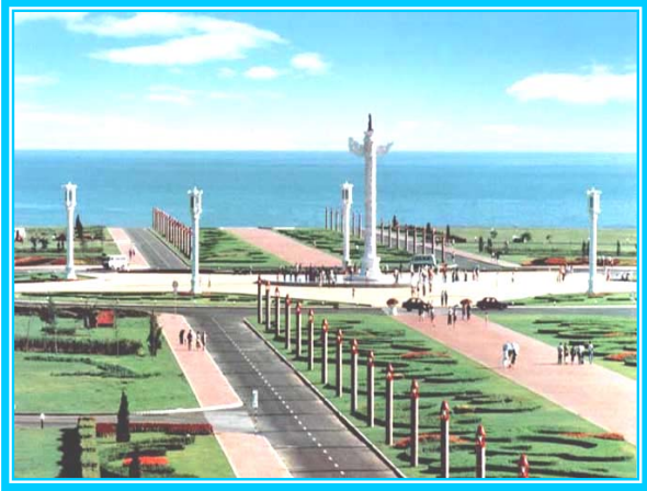
讲述大连人自己的故事