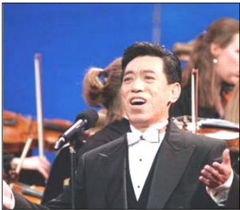
在全球华人新年晚会上演出 (纽约无线电音乐城, 2006)

话未几句，关贵敏便痛感于如今的中国社会道德风气下滑之快，演艺界亦不例外。在那样的大染中，不受污染很难，甚至变得不好了都意识不到。