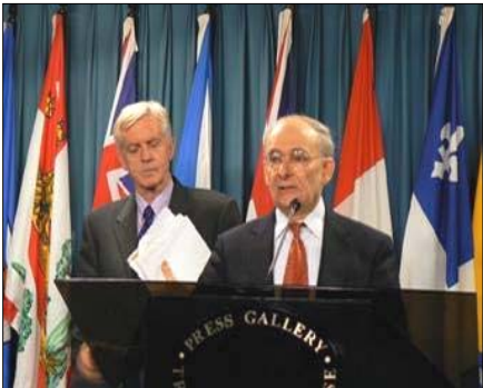
麦塔斯和乔高在新闻发布会上