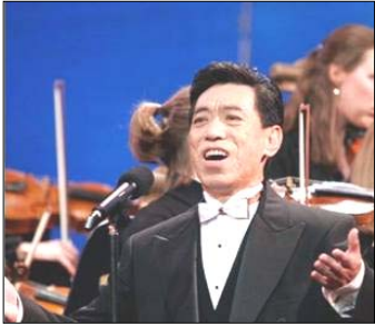
在全球华人新年晚会上演出 (纽约无线电音乐城, 2006)

话未几句，关贵敏便痛感于如今的中国社会道德风气下滑之快，演艺界亦不例外。在那样的大染中，不受污染很难，甚至变得不好了都意识不到。