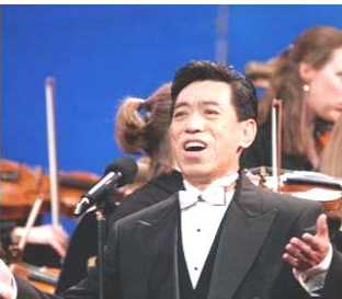
在全球华人新年晚会上演出 (纽约无线电音乐城，2006年)

新唐人华人新年晚会波士顿首场演出期间，有机会采访了著名男高音歌唱家关贵敏先生。话未几句，关贵敏便痛感于如今的中国社会道德风气下滑之快，演艺界亦不例外。在那样的大染缸中，不受污染很难，甚至变得不好了都意