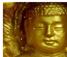
韩国全罗南道顺天市海龙面的须弥山禅院的佛像上出现佛家传说中的优昙婆罗花