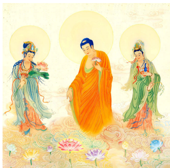
中国大陆法轮功学员绘画：慈悲洒甘露

【明慧网】十四年前，1992年5月13日，李洪志先生于长春将法轮佛法公诸于世，以“真善忍”法理，净化了人们的身心灵，使之远离了百病缠身的痛楚、精神空虚的颓废和尔虞我诈的疲惫，给人们指明了一条修心向善、返本归真之路。至1999年短短7年，靠人传人，心传心，法轮功传遍了中国大江南北，更远涉重洋在异域扎根，给亿万修炼者及其家庭和社会带