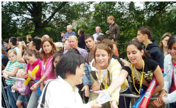
第30届国际 △人们纷纷索要精美的洪法书签