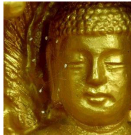
韩国全罗南道顺天市海龙门的须弥山禅院的佛像上出现佛家传说中的优昙婆罗花

法轮功创始人于二00五年二月十五、十七两日连续发表“再转轮”、“向世间转轮”。或许对世人来说，两文题目中两次使用的“转轮”一词颇为陌生，不