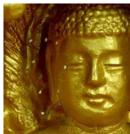
韩国全罗南道顺天市海龙门的须弥山禅院的佛像上出现佛家传说中的优昙婆罗花

法轮功创始人于二00五年二月十五、十七两日连续发表“再转轮”、“向世间转轮”。或许对世人来说，两文题目中两次使用的“转轮”一词颇为陌生，不