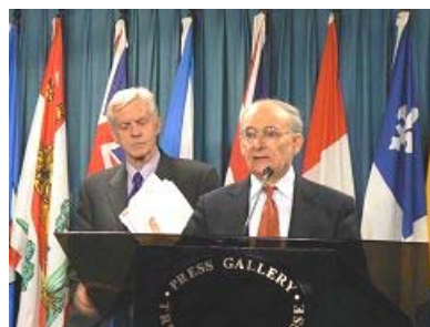
国际人权律师麦塔斯(讲话者)和乔高在新闻发布会上