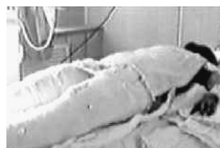
中央电视台“天安门自焚案”中的镜头：“烧伤病人”全身包裹。