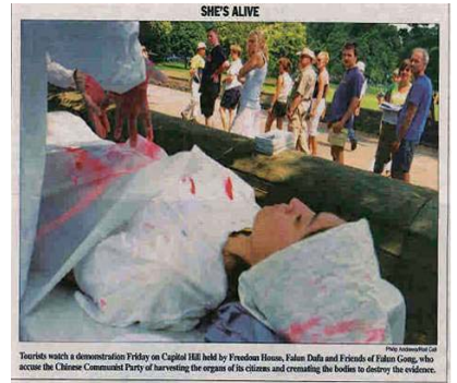
7 月 24 日美国国会山《点名 (Roll Call)》报刊登模拟中共活摘法轮功学员器官展图片

哪来的那么多活供体？最近曝光出来的从监狱、劳教所等地非法关押的法轮功学员身上摘取活体器官案，揭开了中国“活体库”的谜底。法轮功学员在江泽民集团和中共的“名誉上搞臭，