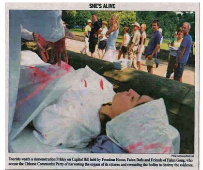
7 月 24 日美国国会山《点名 (Roll Call)》报刊登模拟中共活摘法轮功学员器官展图片

哪来的那么多活供体？最近曝光出来的从监狱、劳教所等地非法关押的法轮功学员身上摘取活体器官案，揭开了中国“活体库”的谜底。法轮功学员在江泽民集团和中共的“名誉上搞臭，