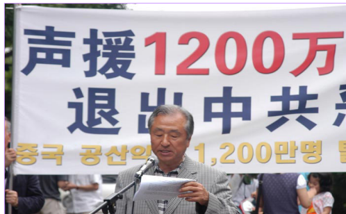
韩国集会的另一主题：声援 1200 万人公开上网声明退党（团、队）

两国民众纷纷谴责中共比当年纳粹还残忍的暴行。一位南姓老人（77 岁）在韩国集会现场向记者表示，“了解到中共这些恶行，尤其是活体摘取贩卖法轮功学员器官一事，我很是震惊，心里很不安……你们要多努力些”一位韩国警察说，“你们做的都是好事，除了游行，若还有别的办法更好。”