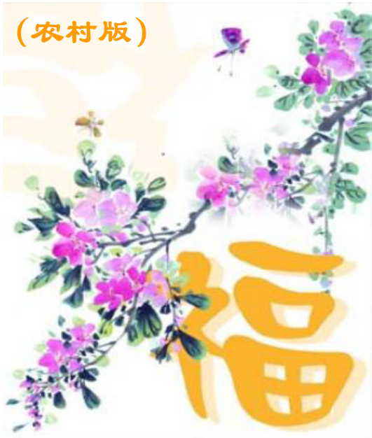
(第 1 期)