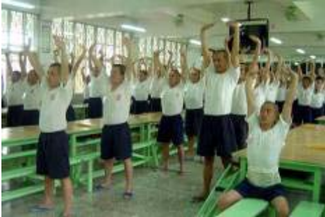
台湾监狱犯人在集体炼功

【明慧网】如何教育监狱服刑的犯人，这在全世界都是难题。台湾监狱在此方面有“绝招”，那就是用法轮功