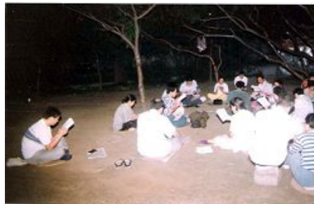
图九：长春大法弟子在炼功点炼完功后集体学法

（我们住四楼）“你们虽然错过了下法轮、开天目的机会，但老师说来了就好，来了就是缘份。你们去准备吧！等老师给你们微调完了，我再拿书给你们看，是《中国法轮功》，书没卖了。”