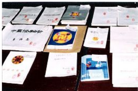
图八：学员们手抄的大法书

从这以后，长春的学员开始成立了学法小组，学法抄法背法。95年初，《转法轮》出版后，大家真正在法上提高了，各地的学员到长春来交流学法体会，后来国外的学员也到长春来，“比学比修”，共同精進，整体提高。（图八）（图九）