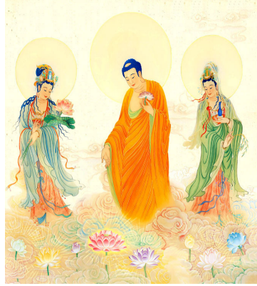
中国大陆法轮功学员绘画： 慈悲洒甘露

【明慧网】十四年前，1992年5月13日，李洪志先生于长春将法轮佛法公诸于世，以“真善忍”法理，净化了人们的身心灵，使之远离了百病缠身的痛楚、精神空虚的颓废和尔虞我诈的疲惫，给人们指明了一条修心向善、返本归真之路。至1999年短短7年，靠人传人，心传心，法轮功传遍了