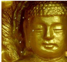
韩国全罗南道顺天市海龙面的须弥山禅院的佛像上出现佛家传说中的优昙婆罗花

书里要求学员要按照真、善、忍要求自己，遇事先想到别人，要求学员首先是一个重德行善的好人。