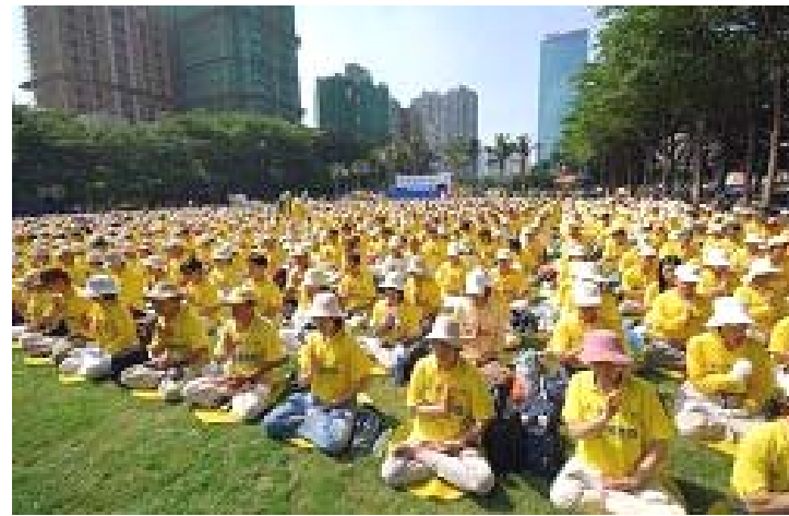
2006 年 7 月 29 日下午在 台中市经国绿园道，台湾 五千名法轮功学员参加 『不信良知唤不回』活动

今年 3 月间，有证人指控中共活体摘取法轮功学员器官。之后，加拿大知名的国际人权律师大卫·麦塔斯（David Matas），以及前加拿大国会议员、也是前外交部亚太司司长大卫·乔高（David Kilgour）组成独立调查团，经过两个月的调查，于 7 月 6 日发表了《关于调查指控中共活体摘取法轮功学员器官的报告》，报告指出，中共大规模从法轮功修炼者身上强行摘取器官的行为确实存在，并仍然持续着。