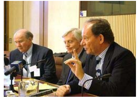
澳洲的国家民事委员会主席彼得·维斯莫（左），欧洲议会副主席爱德华（右）在澳国会大厦举行的新闻发布会上发言

澳国家民事委员会（NCC）主席彼得·维斯莫也在新闻发布会上表达对中共活体摘取法轮功学员器官关注。