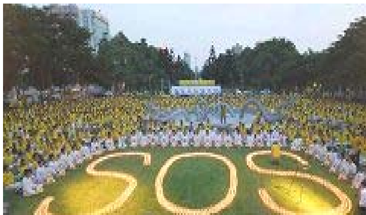
“追悼生命无价，唤醒良善，制止迫害”烛光追悼会

主办单位表示，活动的目的地是唤醒被中共政权欺骗的中国人，希望他们不要为了短暂的现实利益而参与中共对法轮功的迫害；同时将中共迫害法轮功的事实真相告诉全世界