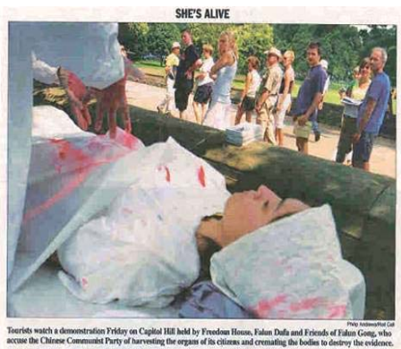
7 月 24 日美国国会山《点名 (Roll Call)》报刊登模拟中共活摘法轮功学员器官展图片

编者按：2006 年 7 月 22 日至 27 日，“首届世界器官移植学术大会”在美国麻省诸塞州波士顿市召开。期间（7 月 24、26 日），著名人权律师泰瑞·玛什，代表所有在中国被强行活摘器官的法轮功学员及其家属，向美国麻省诸塞州的检察处正式递交刑事诉讼状，起诉三名中国外科医生涉嫌强制活体摘取法轮功