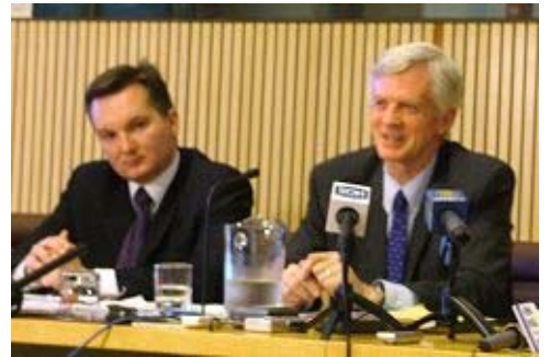
澳洲国会议员奎斯·伯文（左）和大卫·乔高（右）在澳国会大厦新闻发布会上

8 月 15 日，悉尼晨锋报、澳洲广播电台的晚间节目和澳洲 ABC 电视台的著名政论性节目 Late line 都对此进行了专题采访报道。