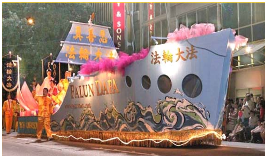
海洋节上的大法船

7月29日晚在美国西雅图举行的第57届“海洋节”中，法轮功学员的“大法船”花车气势宏伟，一路上引来外国观众不断地喊：“法轮功！”、“中国！”“我爱中国！”