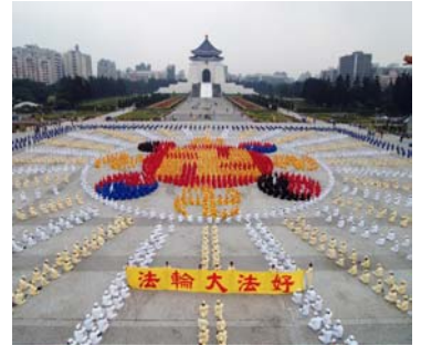
2005 年 12 月 4000 多名台湾法轮功学员在台北中正纪念堂广场前排队法轮图形

1999 年中国大陆镇压法轮功，当时台湾法轮功学员只有 3-5 千人，99 年以后台湾学炼法轮功的人数迅速增加到 30-50 万人，增加了 100 倍。现在法轮大法的主要著作已被译成 30 多种文字，在世界各地出版发行。李洪志先生从 2000 年起四度获诺贝尔和平奖提名。