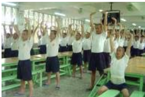
台湾监狱犯人在集体炼功

如何教育监狱服刑的犯人，这在全世界都是难题。台湾监狱在此方面有“绝招”，那就是用法轮功的“真善忍”来教化犯人，几年来收到奇效。