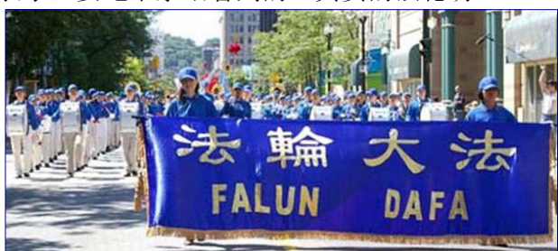
▲加拿大天国乐队参加“加勒比海节”游行

2006年8月12日,由加拿大多伦多120名法轮功学员组成的天国乐队,参加了汉密尔顿市加勒比海游行。乐队雄壮的鼓乐、祥和的精神风貌,赢得了市民的阵阵掌声。一位中国男士对着军乐队不停地拍照,他说,在大陆看到的宣传,和这里看到的完全不同。他表示,要记下亲眼看到的、真实的法轮功。◇