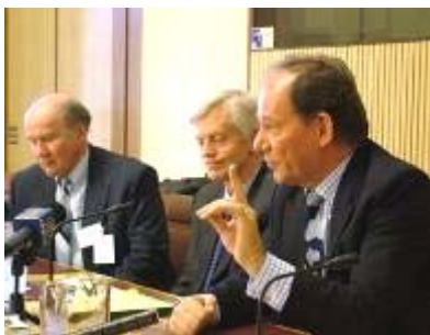
欧议会副主席爱德华（右）在澳洲的新闻发布会上发言

洲，向澳洲政界及公众报告关于“中共活体摘取法轮功学员器官”的调查，并与澳洲政要共商揭露被中共刻意隐瞒的活摘器官惨案，以结束对法轮功修炼者的迫害。