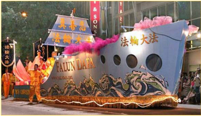
▲7月29日晚法轮功学员的“大法船”花车气势磅礴地行驶在美国西雅图“海洋节炬光游行”上，恢宏壮观，一路上引来外国观众不断地喊：“法轮功！”、“中国！”“我爱中国！”