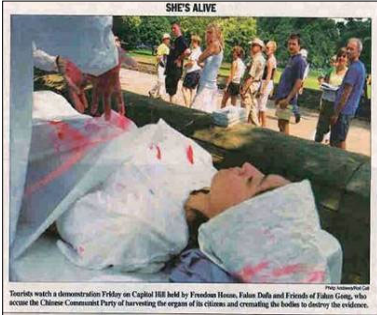
7 月 24 日美国国会山《点名 (Roll Call)》报刊登模拟中共活摘法轮功学员器官展图片

7 月下旬，他们三人在美国波士顿出席首届世界器官移植大会时，法轮功学员向美国麻州检察处正式递交刑事起诉状，控告他们触犯酷刑罪。原因是他们所在的移植中心涉嫌参与活体摘取法轮功学员器官。三家医院的医生在电话录音中均承认，为病人移植的