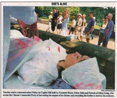
7 月 24 日美国国会山《点名 (Roll Call)》报刊登模拟中共活摘法轮功学员器官展图片

7 月下旬，他们三人在美国波士顿出席首届世界器官移植大会时，法轮功学员向美国麻州检察处正式递交刑事起诉状，控告他们触犯酷刑罪。原因是他们所在的移植中心涉嫌参与活体摘取法轮功学员器官。三家医院的医生在电话录音中均承认，为病人移植的