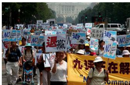
横幅：“退党”、“九评正在解体中共”

请用国外邮箱给 eo@att.net 发一封标题为 12345 的电子邮件可获得最新突破网络封锁软件，看到外面真实的世界！