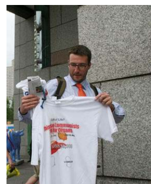
全球器官移植学术会议期间揭露中共活摘器官的真相文化衫成为抢手货

据悉，上百名中国外科医生及医疗人员前往美国参加此次会议。这一刑事诉讼是，中共活摘法轮功学员器官暴行继7月6日加拿大独立调查团报告证实法轮功团体指控为真实后，法轮功就活摘器官暴行所提起的第一起国际人权诉讼。