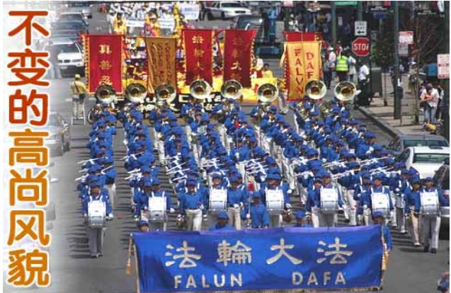
【明慧网】2006年6月24日，一千多名来自世界各地的法轮功学员在美国芝加哥市举行盛大游行。雄壮祥和的游行队伍赢得了人们的欢迎。游行表达了

★ 国际上有35位律师代表受迫害的法轮功学员以群体灭绝罪、酷刑罪和反人类罪共同起诉同一被告江泽民及其同伙，这被海外媒体称为二次大战后对纳粹党审判以来最大的人权诉讼。