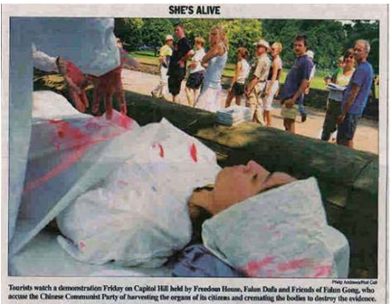
7 月 24 日美国国会山《点名(Roll Call)》报刊登模拟中共活摘法轮功学员器官展图片