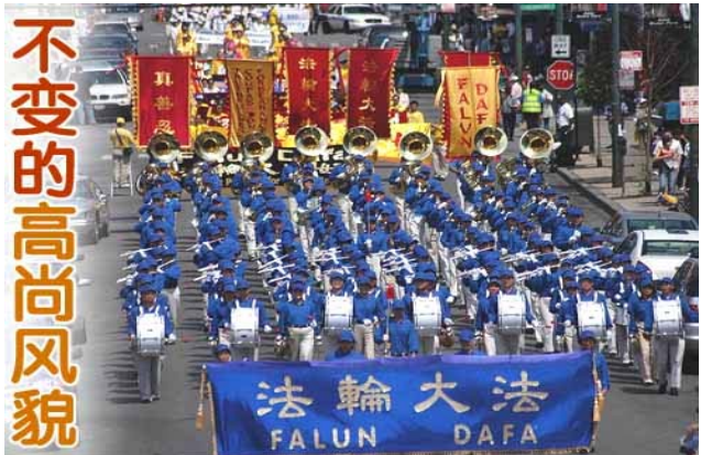
【明慧网】2006年6月24日，一千多名来自世界各地的法轮功学员在美国芝加哥市举行盛大游行。雄壮祥和的游行队伍赢得了人们的欢迎。游行表达了

★ 国际上有35位律师代表受迫害的法轮功学员以群体灭绝罪、酷刑罪和反人类罪共同起诉同一被告江泽民及其同伙，这被海外媒体称为二次大战后对纳粹党审判以来最大的人权诉讼。