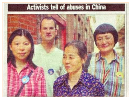
▲英国谢菲尔德今日报图片

英国谢菲尔德今日报（Sheffield Today）8 月 14 日发表题为“人权活动者讲述法轮功学员在中国正受到迫害”的文章，报导了英国