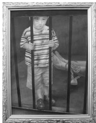
▲《为什么》，油画 汪卫星，2004

善良的人们，有谁能救救月童一家？月童想回家，想和爸爸妈妈一起回家，她已经到了上学的年龄了，她该上学了……◇