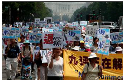
横幅：“退党”、“九评正在解体中共”

请用国外邮箱给 eo@att.net 发一封标题为 12345 的电子邮件可获得最新突破网络封锁软件，看到外面真实的世界！