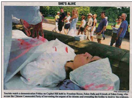
▲7 月 24 日，美国国会山《点名(Roll Call)》报刊登模拟中共活摘法轮功学员器官展图片

那么，在中国仅有 4% 为亲属间移植的情况下，为什么能在短期内成为世界移植大国呢？现在，我们知道，是因为这些移植中心有大量的活体器官来源。虽然活体并非来自亲属，但巨大数量的活体本身，就提供了对移植质量的保障。