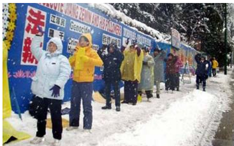
加拿大温哥华大雪纷飞，法轮功学员仍然冒着大雪，坚持在中领馆前请愿