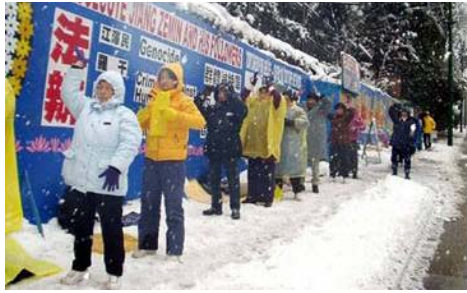
加拿大温哥华大雪纷飞，法轮功学员仍然冒着大雪，坚持在中领馆前请愿