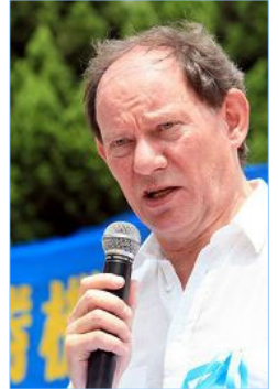
斯考特先生宣布加入“法轮功受迫害真相联合调查团”

斯考特先生接受采访时说：“欧洲议会曾再三对法轮功在中国遭受的对待表示关注，那是极为糟糕的状况。我来到这里，表达我的深切关注，并警告那些要负上责任的人，他们在适当的时候会被绳之以法。”◇