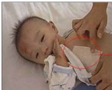
断了七个月大的婴儿四根肋骨