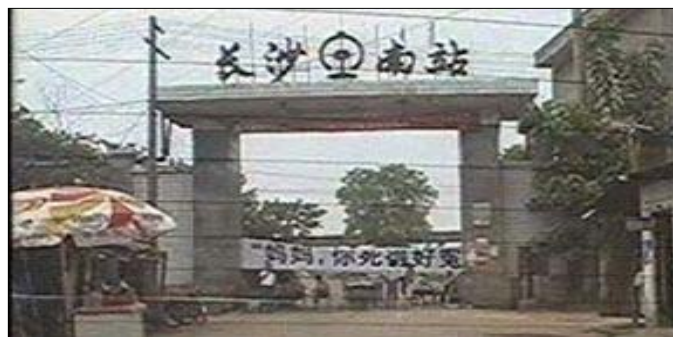
死者家属在长沙南站打横幅喊冤