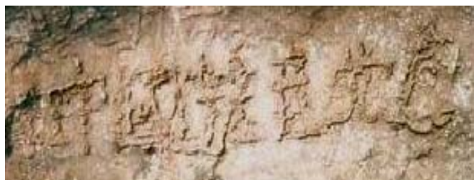
断面内六个大字“中国共产党亡”。每个字近一尺见方

贵州平塘“中国共产党亡”的飞来巨石不也在昭示着世人，中共恶党的邪恶、残暴统治即将灭亡吗？天意不可违。世人赶快清醒，告诉你的家人、亲朋好友、左邻右舍、单位同事及一切认识或不认识的人，立即退出中共恶党及一切邪恶组织，只有这样生命才能得到拯救。善待大法一念，幸福、平安、吉祥。