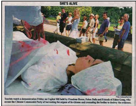
7月24日美国国会山《点名(Roll Call)》报刊登模拟中共活摘法轮功学员器官展图片

在世界其他国家，器官主要是靠人们的自愿捐献，而中国的文化传统讲究全尸入殓。这些专家们很清楚中国的器官移植面临的重大难题，就是器官短缺。但是，“无米之炊”并没有难倒这些移植领域的“巧