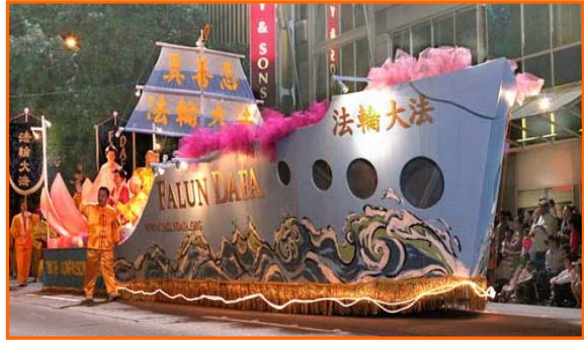
海洋节上的大法船

7月29日晚在美国西雅图举行的第57届“海洋节”焰火游行中，法轮功学员的“大法船”花车气势宏伟，一路上引来外国观众不断地喊：“法轮功！”、“中国！”“我爱中国！”◇