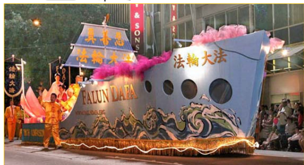
海洋节上的大法船

7月29日晚在美国西雅图举行的第57届“海洋节炬光游行”中，法轮功学员的“大法船”花车气势宏伟，一路上引来外国观众不断地喊：“法轮功！”、“中国！”“我爱中国！”