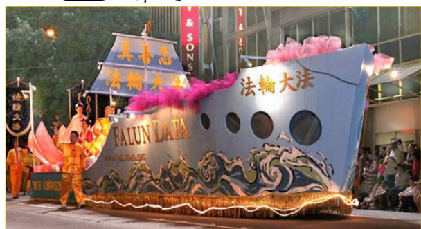
海洋节上的大法船

唐山郊区一个小村庄，住着一位年过八旬的老太。因她被戴上了富农分子帽子，20多年来一直受管制。老人不论在家里还是在生产队，整天都是默默无闻，除了干活就是干活，从不多言语，更不与人争辩。76年唐山大地震的前两天，她突然跑到村干部家里，告诉他要发生大地震了，赶快转告全村的人离开这里。村干部听后，认为她胡言乱语，就把她给轰出去