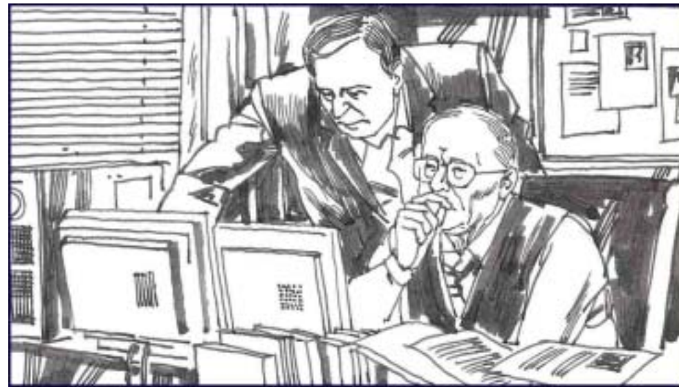
10. 同时，加拿大前亚太司司长、资深国会议员大卫·乔高和国际人权律师大卫·麦塔斯受“法轮功受迫害真相联合调查团”（CIPFG）的委托组成的独立调查组也在加紧工作，调查中共活体摘取法轮功学员器官的真实性。