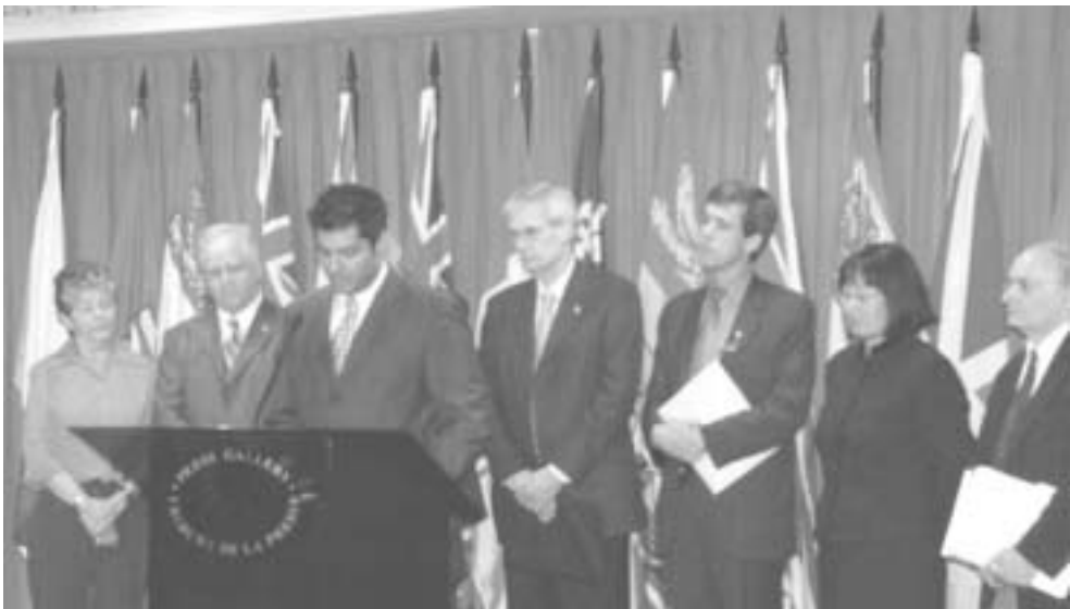
18. 对此加拿大各党议员表示，“不但加拿大政府要采取行动，我们还要和其他国家政府合作调查，把调查结果提交到国际法庭，起诉和惩办相关人员。”善恶必报，江及其中共爪牙必将被钉在人类历史的耻辱柱上。