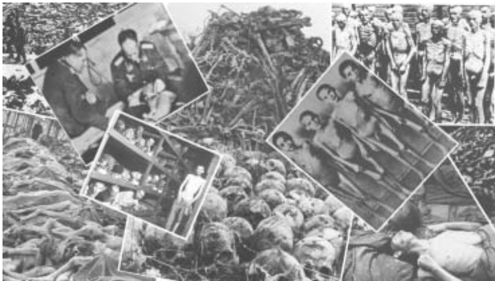
1. 二战刚开始，美国政要就被告知纳粹迫害的残酷。因为太耸人听闻，人们难以置信而没有制止。当联军打进纳粹集中营却被现实惊呆了。因此 48 年联合国大会通过《防止及惩办灭绝种族罪公约》，人类以此保证这样的悲剧绝不会重演。