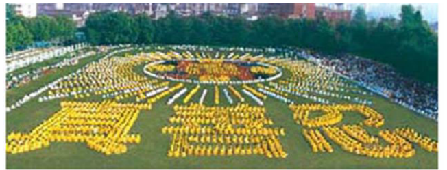
湖北省武汉市，5000多法轮功学员集体炼功， 组成“法轮图形”和“真善忍” ---1997