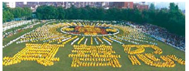
湖北省武汉市，5000多法轮功学员集体炼功， 组成“法轮图形”和“真善忍” ---1997