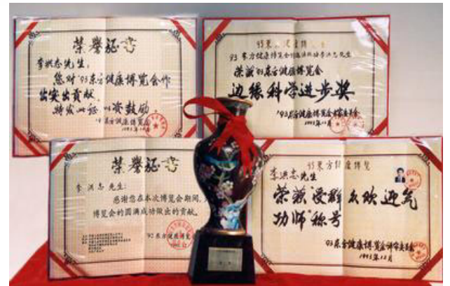
世界各国褒奖及法轮功创始人在九三年 东方健康博览会上的获奖证书