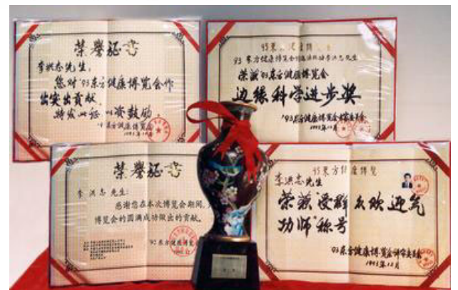
世界各国褒奖及法轮功创始人在九三年 东方健康博览会上的获奖证书