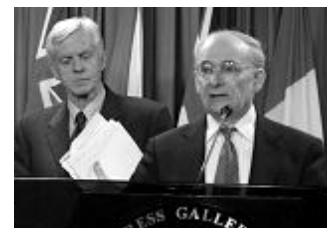
国际人权律师麦塔斯（右）和乔高在新闻发布会上

报告“结论”部分指出：“我们已经得出结论，中国政府及其分布在全国许多地区的执行机构，尤其是医院还有拘留所和“人民”法院，自从 1999 年以来，已把大量、但具体数字不详的法轮功良心犯处死。他们的器官，包括心脏、肾脏、肝脏和眼角膜，几乎同时都被掠摘，然后被高价出售，有时被卖给外国人，这些外国人在他们的国家里通常需要等候很久才能得到自愿的器官捐赠。”