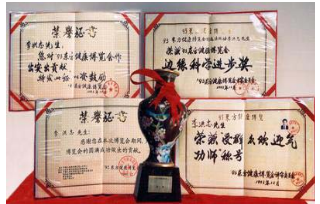
法轮功创始人在九三年东方健康博览会上的获奖证书