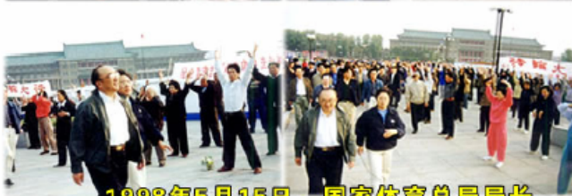
1998年5月15日，国家体育总局局长伍绍祖亲赴法轮大法发祥地长春考察

1998年国家体育总局对广东省万余名法轮功学员的调查结果是：法轮功祛病健身总有效率高达97.9%。1998年下半年，由前人大委员长乔石所主持的对法轮功的官方调查得出的结论是：法轮功于国于民有百利而无一害。◇