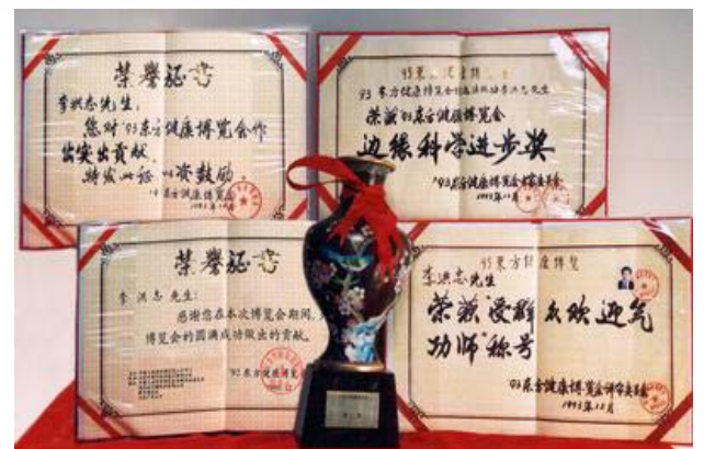
法轮功创始人在九三年东方健康博览会上的获奖证书