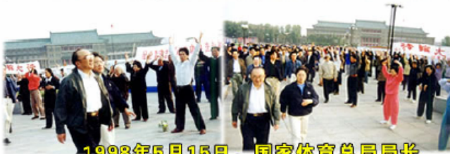
1998年5月15日，国家体育总局局长伍绍祖亲赴法轮大法发祥地长春考察

1998年国家体育总局对广东省万余名法轮功学员的调查结果是：法轮功祛病健身总有效率高达97.9%。1998年下半年，由前人大委员长乔石所主持的对法轮功的官方调查得出的结论是：法轮功于国于民有百利而无一害。◇