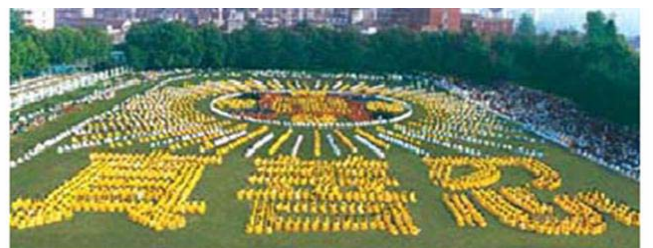
湖北省武汉市，5000 多法轮功学员集体炼功，组成“法轮图形”和“真善忍” ---1997