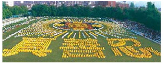
湖北省武汉市，5000 多法轮功学员集体炼功，组成“法轮图形”和“真善忍” ---1997