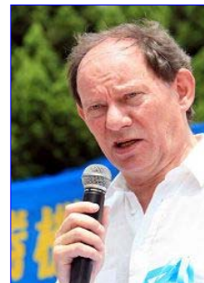
斯考特宣布加入法轮功受迫害真相联合调查团

麦克米兰-斯考特随后接受访问时说：“欧洲议会曾再三对法轮功在中国遭受的对待表示关注，我相信群体灭绝正在中国发生。我来到这里，真的只是要表达我的深切关注，并警告那些要负上责任的人，他们在适当的时候会被绳之以法。”