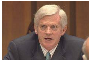
乔高就中共活摘器官暴行在联合国人权理事会上发言