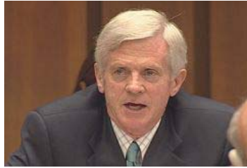
乔高就中共活摘器官暴行在联合国人权理事会上发言