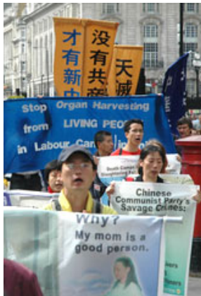
英国法轮功学员在伦敦游行呼吁关注,共同终止中共对法轮功的迫害。

亲从千里之外的家乡赶来,那时我已经绝食多天,每天被强行插管灌食,身体虚弱。母亲没有说太多劝我进食的话,她说她理解我的选择。母亲也和狱方据理力争,要求释放我,因为我没有犯罪。以前,母亲每次面对来家骚扰的警察总是避之不急的。我对母亲说,我一定会很快回家,因为邪不压正!母亲点头说“我等你回来!”不久,我被无条件释放。