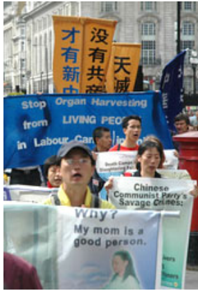
英国法轮功学员在伦敦游行呼吁关注,共同终止中共对法轮功的迫害。