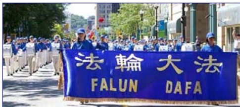
▲加拿大天国乐队参加 「加勒比海节」游行

1995年3月和5月，李洪志老师应邀到法国和瑞典传功讲法，拉开了法轮大法在海外洪传的序幕。至今已传遍世界上近八十个国家和地区，全球有上亿人修炼法轮功。法轮大法因其“真善忍”法理带给世界的美好，收到世界各国政府机构、议员、团体组织等对法轮大法和创始人的褒奖、支持议案和信函已超过达2661项（至2006年6月）。法轮大法主要著作《转法轮》等，已翻译成30种语言在世界各地出版发行。并可在互联网上免费下载。