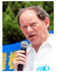
▲斯考特宣布加入“法轮功受迫害真相联合调查团”

【明慧网】欧洲议会副主席爱德华·麦克米兰-斯考特8月26日上午参加由香港大纪元时报与香港退党服务中心主办的声援1,300万人退出中共集会时宣布加入“法轮功受迫害真相联合调查团”，并与一起出席的香港立法会议员何俊仁发表联合声明，呼吁世界各地的律师，就中国大陆著名维权律师高智晟遭到秘密逮捕与酷刑虐待一事，向当地的中共使领馆提出抗议，要求中共当局立即释放高智晟律师。