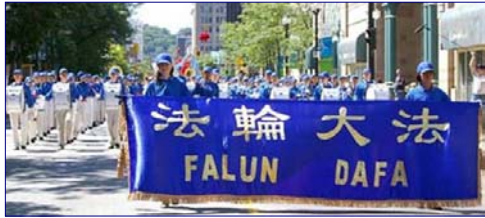
▲加拿大天国乐队参加 「加勒比海节」游行

1995年3月和5月，李洪志老师应邀到法国和瑞典传功讲法，拉开了法轮大法在海外洪传的序幕。至今已传遍世界上近八十个国家和地区，全球有上亿人修炼法轮功。法轮大法因其“真善忍”法理带给世界的美好，收到世界各国政府机构、议员、团体组织等对法轮大法和创始人的褒奖、支持议案和信函已超过达2661项（至2006年6月）。法轮大法主要著作《转法轮》等，已翻译成30种语言在世界各地出版发行。并可在互联网上免费下载。