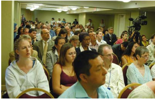
图为“中共非法活摘器官”论坛现场

德国医学博士托斯顿·泰瑞在集会上说，“如果我们忽视在中国发生的这种系统性的迫害法轮功学员并活体摘取他们器官的行径，这将玷污世界器官移植学界的名誉。”◇