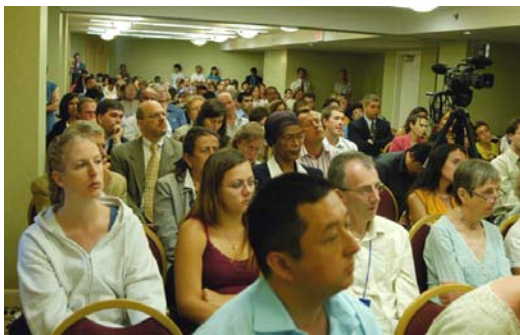
图为“中共非法活摘器官”论坛现场

德国医学博士托斯顿·泰瑞在集会上说，“如果我们忽视在中国发生的这种系统性的迫害法轮功学员并活体摘取他们器官的行径，这将玷污世界器官移植学界的名誉。”◇