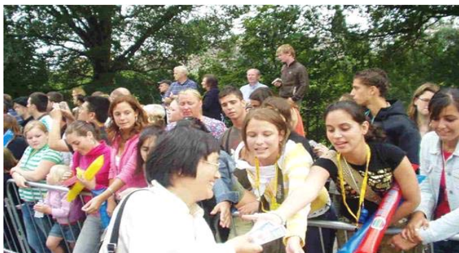
▲第30届国际艺术节大游行 2006年8月6日于 苏格兰首府爱丁堡举行。人们纷纷索要法轮功学员 制作的小莲花和“世界需要真善忍”的精美书签。

又将先抓进去的人在南岗分局前厅又让恶警猛打一顿， 又把在外面的所有家属带到看守所去了。