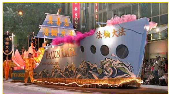
海洋节上的大法船

▲7 月 29 日晚在美国西雅图举行的第 57 届“海洋节炬光游行”中，法轮功学员的“大法船”花车气势宏伟，一路上引来外国观众不断地喊：“法轮功！”、“中国！”“我爱中国！”