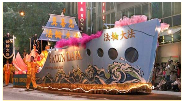
海洋节上的大法船

▲7 月 29 日晚在美国西雅图举行的第 57 届“海洋节炬光游行”中，法轮功学员的“大法船”花车气势宏伟，一路上引来外国观众不断地喊：“法轮功！”、“中国！”“我爱中国！”