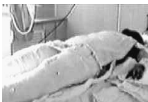
中央电视台“天安门自焚案”中的镜头：“烧伤病人”全身包裹。