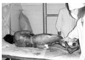
真正的烧伤病人要在空气中晾着，护理人员要穿卫生服，戴口罩防感染。