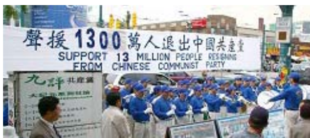
加拿大多伦多市退党服务中心, 举行声援 1300 万民众退出中共。法轮功天国乐团的 30 名成员到场声援。

法轮功学员传播“九评”不是为了打倒中共和争夺权力，而是为了帮助人们认清中共的邪恶本质，不再有意无意地随从其继续迫害法轮功，使发生了七年多的迫害早日停止。