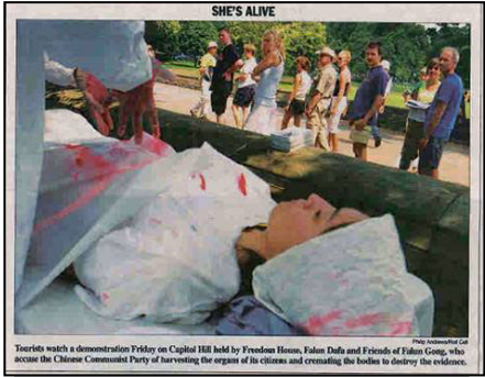
7月24日美国国会山《点名(Roll Call)》报刊登模拟中共活摘法轮功学员器官展图片

中国的器官移植面临的重大难题，就是器官短缺。但是，“无米之炊”并没有难倒这些移植领域的“巧妇”们，名利的诱惑使他们在这些年依然取得了瞩目“成绩”，使中国成为器官移植大国。