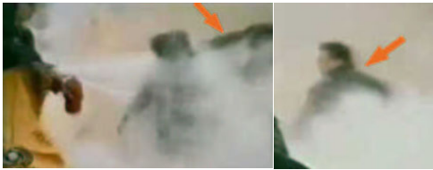
1, 刘头部受重击 2, 打击者仍保持用力姿势

在五年前的天安门“自焚”案中，参与者刘春玲被打死，女儿刘思影随后在医院里莫名死亡。中共江泽民集团以“自焚”案嫁祸法轮功，煽动民众的仇恨，为升级迫害开路。那么，刘春玲是何人？她为何参与“自焚”？2006年5月12日，刘春玲的近门邻居，讲述了她当时的一些情况。