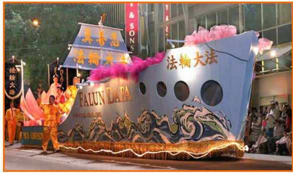
海洋节上的大法船

在世界其他国家，器官主要是靠人们的自愿捐献，而中国的文化传统讲究全尸入殓。这些专家们很清楚