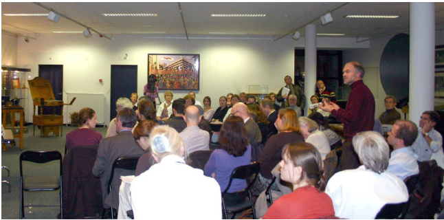
万可润可斯文参议员在“器官移植的伦理问题研讨会”上发言

的真相正在逐渐大白于天下，那些发动这场残酷迫害的元凶和主使者不断的被世界各地以群体灭绝罪、反人类罪、非法骚扰罪告上法庭，众多积极参与迫害的人及其家人遭恶报的情况也频频发生。在此，奉劝还在迫害大法弟子的不法之徒们：不要一叶障目当恶党的殉葬品。多行不义必自毙，天灭中共是历史的必然，那些还在参与迫害大法弟子的人唯有立即停止迫害行为，弃恶从善，才是真正的对自己生命负责，才能免于为江氏流氓集团陪葬的下场。