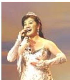
女高音歌唱家白雪