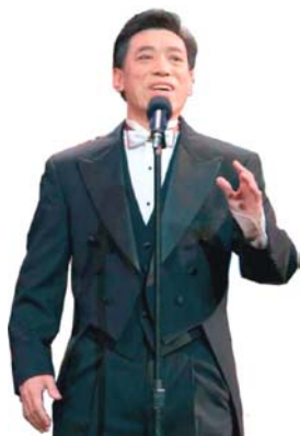
关贵敏在零六年全球华人新年晚会上演出

关贵敏，于一九七八年考入中央电影乐团成为专业歌手。他音域宽广、音色明亮纯厚，在歌唱界独树一帜，是国家一级演员、著名男高音歌唱家。