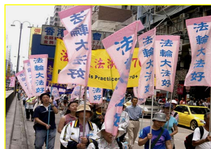
▲香港“法轮大法好”彩旗飘扬