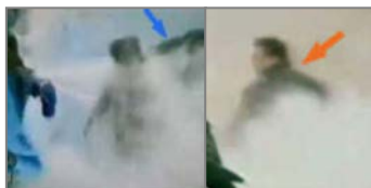
1. 刘春玲头部受重击 2. 打者仍保持用力姿势

** 在对法轮功的迫害中，江泽民集团利用其对媒体的绝对控制，制造了形形色色的谎言，煽动人们对法轮功的仇恨。同时，剥夺法轮功学员申诉的权利，大搞“一言堂”，中国老百姓就很难得知事实真相。