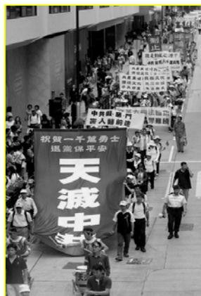
“天滅中共”大幡 在香港九龙闹市区

我一听此话有些不对劲，因为我小叔子就是炼法轮功的，我了解他们都是冒着被抓、被打、被判刑、甚至生命危险在救人，资料是他们省吃俭用的钱来做的。到哪儿去领工资呢？于是我对那个中国导游说：“那他们一个月领多少钱？”那个导游的脸刷一下红了，说：“快走！赶上队伍。”随行人员都笑了。