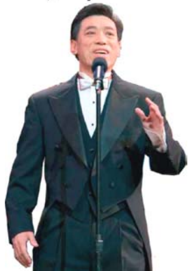
关贵敏在零六年全球 华人新年晚会上演出

关贵敏，于一九七八年考入中央电影乐团成为专业歌手。他音域宽广、音色明亮纯厚，在歌唱界独树一帜，是国家一级演员、著名男高音歌唱家。