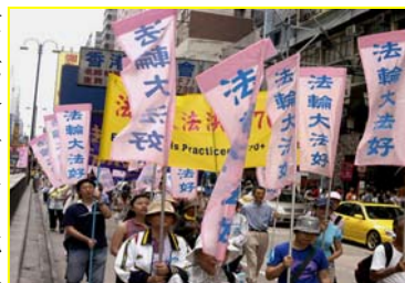
香港“法轮大法好”彩旗飘扬