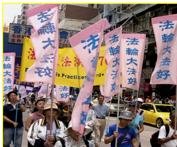
香港“法轮大法好”彩旗飘扬

万没想到在将离开香港时,中国导游突然对大家说“各位游客,请将你们得到的法轮功宣传品一张不留的全交出来扔到垃圾箱里,否则上飞机搜查出一张,坐牢七天,罚款五千元,由原单位出证明方可取保。”