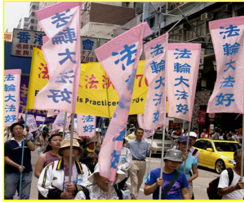
香港“法轮大法好”彩旗飘扬

万没想到在将离开香港时,中国导游突然对大家说“各位游客,请将你们得到的法轮功宣传品一张不留的全交出来扔到垃圾箱里,否则上飞机搜查出一张,坐牢七天,罚款五千元,由原单位出证明方可取保。”