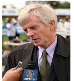
加拿大调查员乔高

【明慧网】近日，加拿大独立调查员大卫·乔高在渥太华接受媒体采访时说，“我们已经出访过全球三十个国家的首都，并发现了更多证据，表明中共活体摘取法轮功学员器官的事正在发生，仍在发生。必须立即停止。” 乔