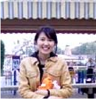
童心未泯的沙米抱着玩熊