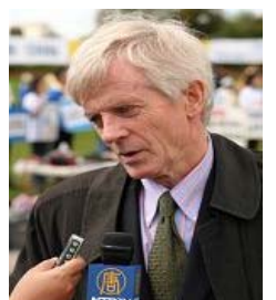
加拿大调查员乔高

【明慧网】近日，加拿大独立调查员大卫·乔高在渥太华接受媒体采访时说，“我们已经出访过全球三十个国家的首都，并发现了更多证据，表明中共活体摘取法轮功学员器官的事正在发生，仍在发生。必须立即停止。” 乔