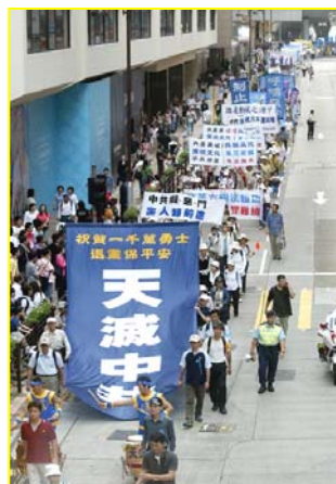
▲“天灭中共”大幡在香港九龙闹市区