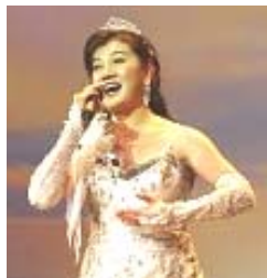
女高音歌唱家白雪